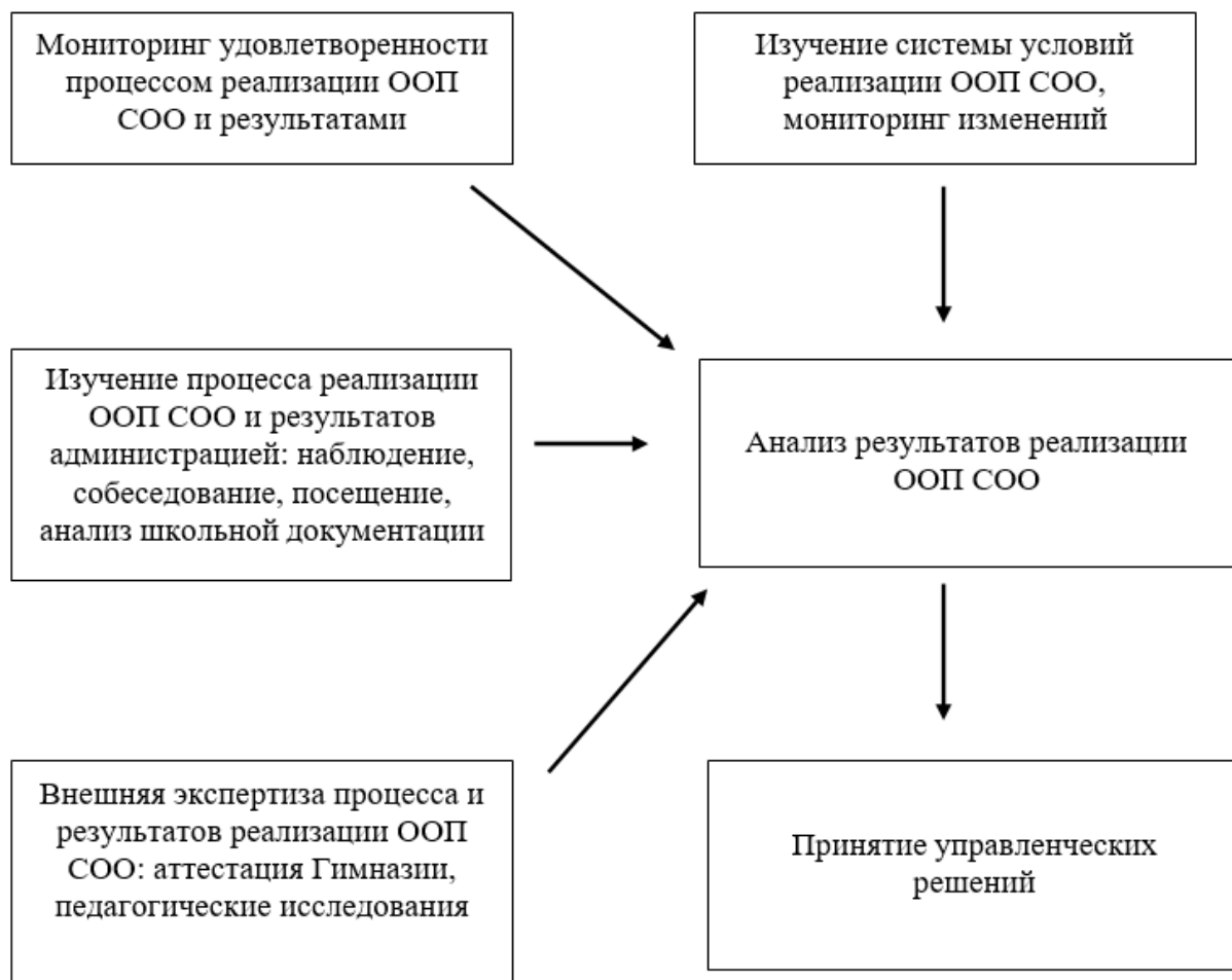
Схема. 1. Механизм принятия управленческих решений

Механизм принятия управленческих решений и обеспечение общественного участия и учета интересов, потребностей участников образовательных отношений, связанных с повышением эффективности реализации ООП, отражен на схеме 1.